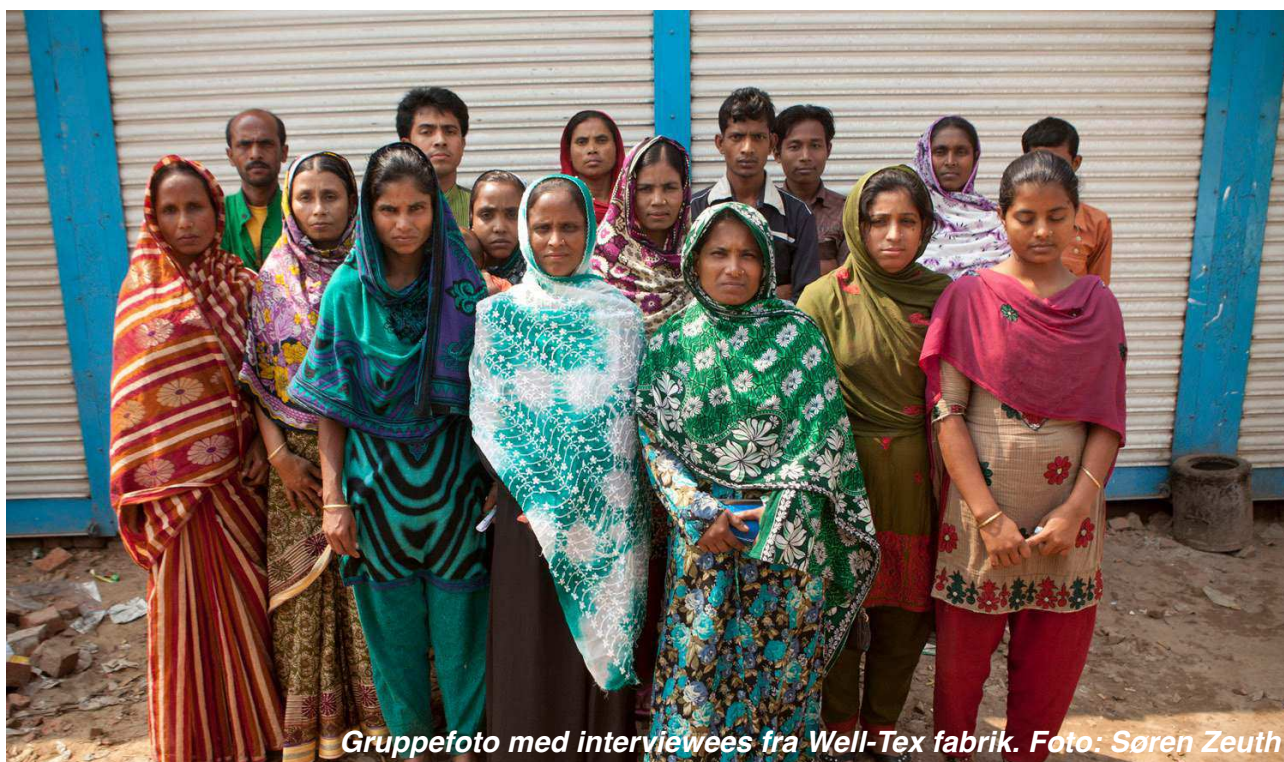
Gruppefoto med interviewees fra Well-Tex fabrik.

‘Hvis I bliver hos os, vil I få penge og et lykkeligt liv. Hvis I tilslutter jer fagforeningen, får I intet’.