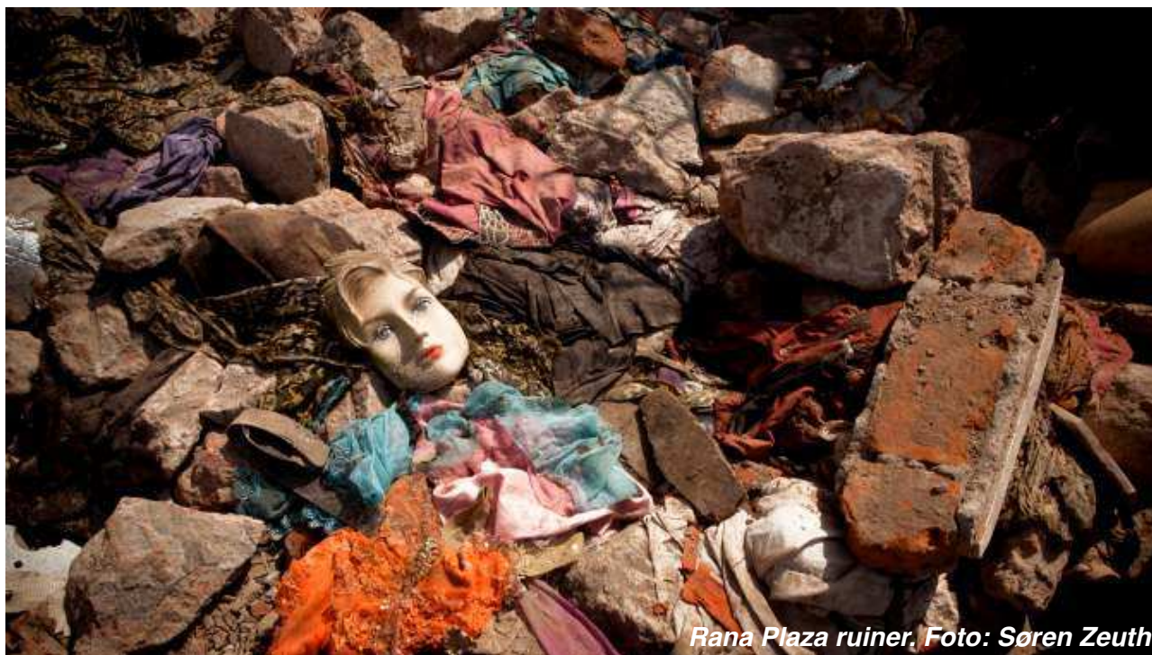
Rana Plaza ruiner

Den 24. april 2013 rettede hele verdens øjne sig mod Bangladesh. En otte-etagers-bygning, hvor tusinder af tekstilarbejdere var i gang med dagens produktion, var styrtet sammen. I de følgende dage steg dødstallet, og begivenheden skulle vise sig at være en af verdens største industrielle katastrofer. Der var mindst 1134 døde og flere end 2000 sårede. I kølvandet fulgte et stort fokus på internationale modebrands, der fik produceret tøj i bygningen og adskillige initiativer både fra branchen og politisk side. Kendte mærker som Benetton og Mango og de to danske virksomheder Mascot og PWT Group er blandt de mere end 15 internationale brands, der har haft produktion på fabrikken Rana Plaza.