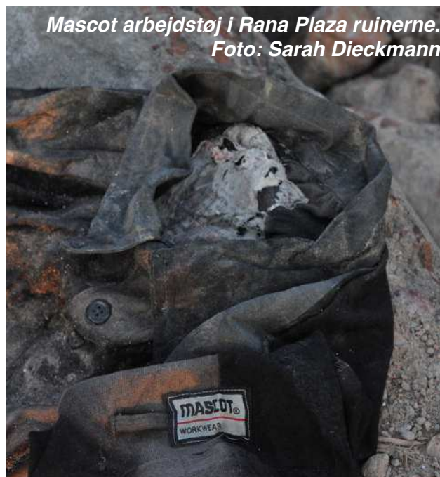
Mascot arbejdstøj i Rana Plaza ruinerne.

PWT Group har base i Aalborg og står bag butikkerne Tøjeksperten og Wagner samt en række brands som f.eks. Shine, Jacks og Lindbergh. PWT Group fik i en årrække produceret skjorter hos New Wawes Style Ltd., der havde til huse på 1. og 5. sal i Rana Plaza komplekset.