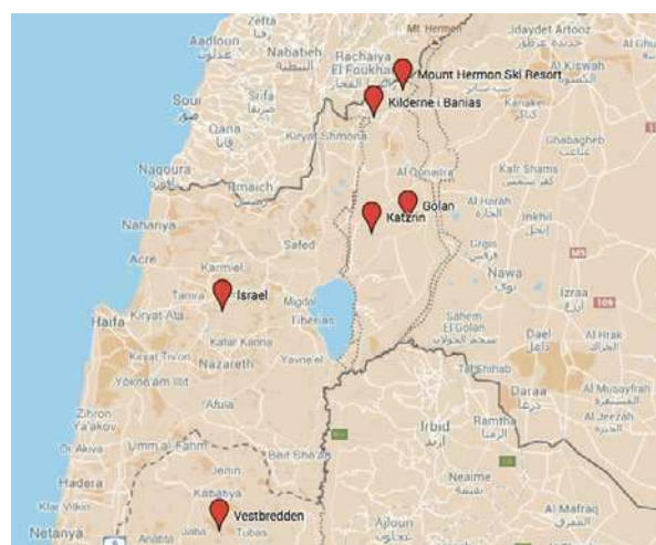
Byer, områder og seværdigheder, som ligger i de besatte Golan-højder: kilderne i Banias, bosættelsen Katzin, Mount Hermon Ski Resort.