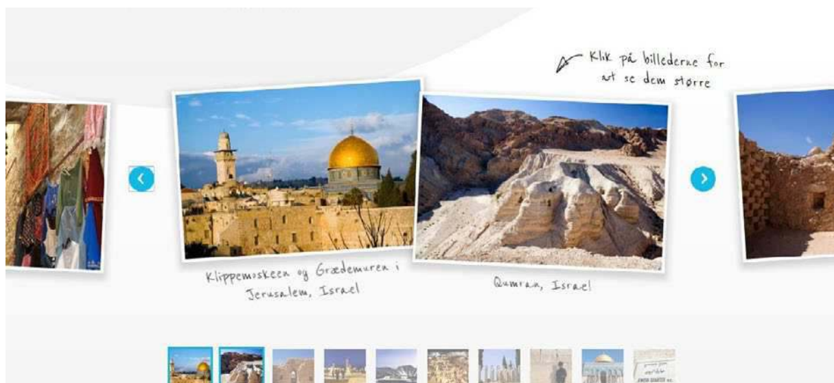
Albatros' hjemmeside der beskriver Qumran som beliggende i Israel