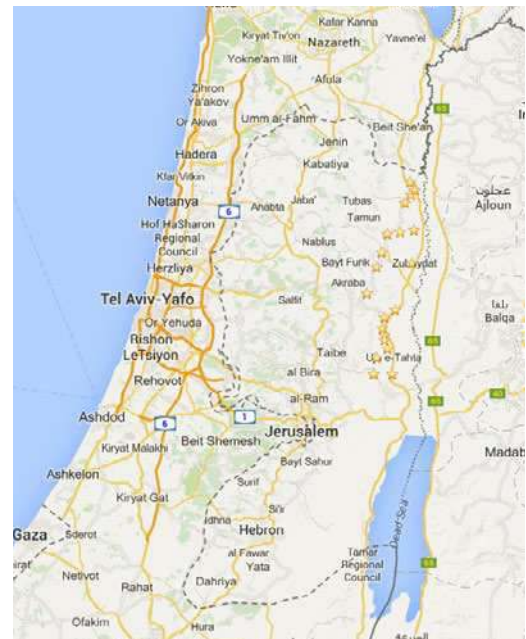
Google Maps. 21 bosættelser i Jordan Valley Regional Council indsat 62

af klimaet, hvor dadler er den mest udbredte afgrøde. 58 I 1980 gik 21 bosættelser sammen i bosættelseskommunen Jordan Valley Regional Council og sammen producerer disse bosættelsers landbrug årligt for omkring 724 millioner kr. ifølge kommunens egne opgørelser, hvoraf store dele af produktionen eksporteres til bl.a. Europa. 59 Den israelske turistorganisation Jordan Valley Tourism skriver på deres hjemmeside, at den israelske produktion fra landbrug i Jordandalen ligger nærmere de 790 millioner kr. 60 Ifølge organisationen for palæstinensisk landbrug og civilsamfund bruges det tilgængelige vand i Jordandalen nærmest eksklusivt af bosættelser til landbrug. Human Rights Watch angiver, at bosætterlandbrug i Jordandalen udnytter det, der svarer til en fjerdedel af det fulde vandforbrug for de ca. 2,5 millioner palæstinensere på den besatte Vestbred. 61